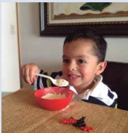
Consumo de leche en polvo descremada se incrementaría en el corto plazo.

Este año ha sido de crisis por la caída del precio de los commodities lácteos, fuertemente afectados desde todos los ámbitos. No solo se han perjudicado la leche en polvo entera y la leche en polvo descremada cuyos precios estuvieron alrededor del 50% entre julio de 2014 y de 2015 (Gráfica 1); también resultaron golpeados