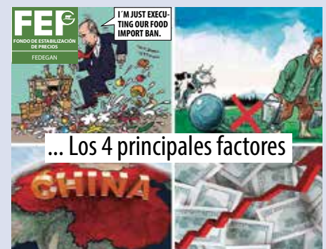
■ Cuatro eventos de la turbulencia del mercado lácteo mundial.

Así como en este panorama de mejora del mercado internacional lácteo, el Fondo de Estabilización de Precios –FEP– FEDEGÁN, seguirá de manera atenta las dinámicas del mercado internacional de los productos ganaderos, informándoles de manera oportuna a los exportadores y fomentando una actividad cada vez mejor orientada a la conquista de los mercados internacionales. ■