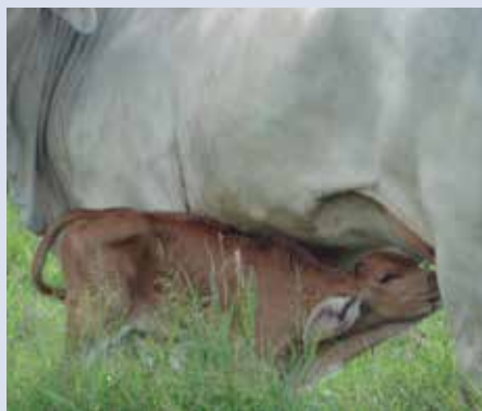
Aumento en producción en la India se debería al incremento en el hato tanto como al de la productividad por animal.

“Ante esta coyuntura y para tener una aproximación de cuál sería el futuro de los productores y procesadores hicimos proyecciones de la producción mundial de