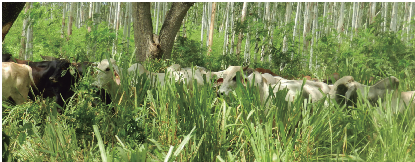
SSPi de Colombia brinda a los bovinos buena condición corporal, refugio, agua, excelente forraje y lo más importante comportamiento natural.

3. Satisfacer las necesidades de un consumidor más educado y exigente. La WAP trabaja con Nestlé y Brasil Foods (empresa brasileña de alimentación y bebidas, fundada en 2009 a través