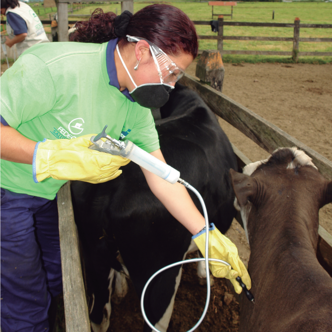
Primer ciclo de vacunación se extendió hasta septiembre de 2015.